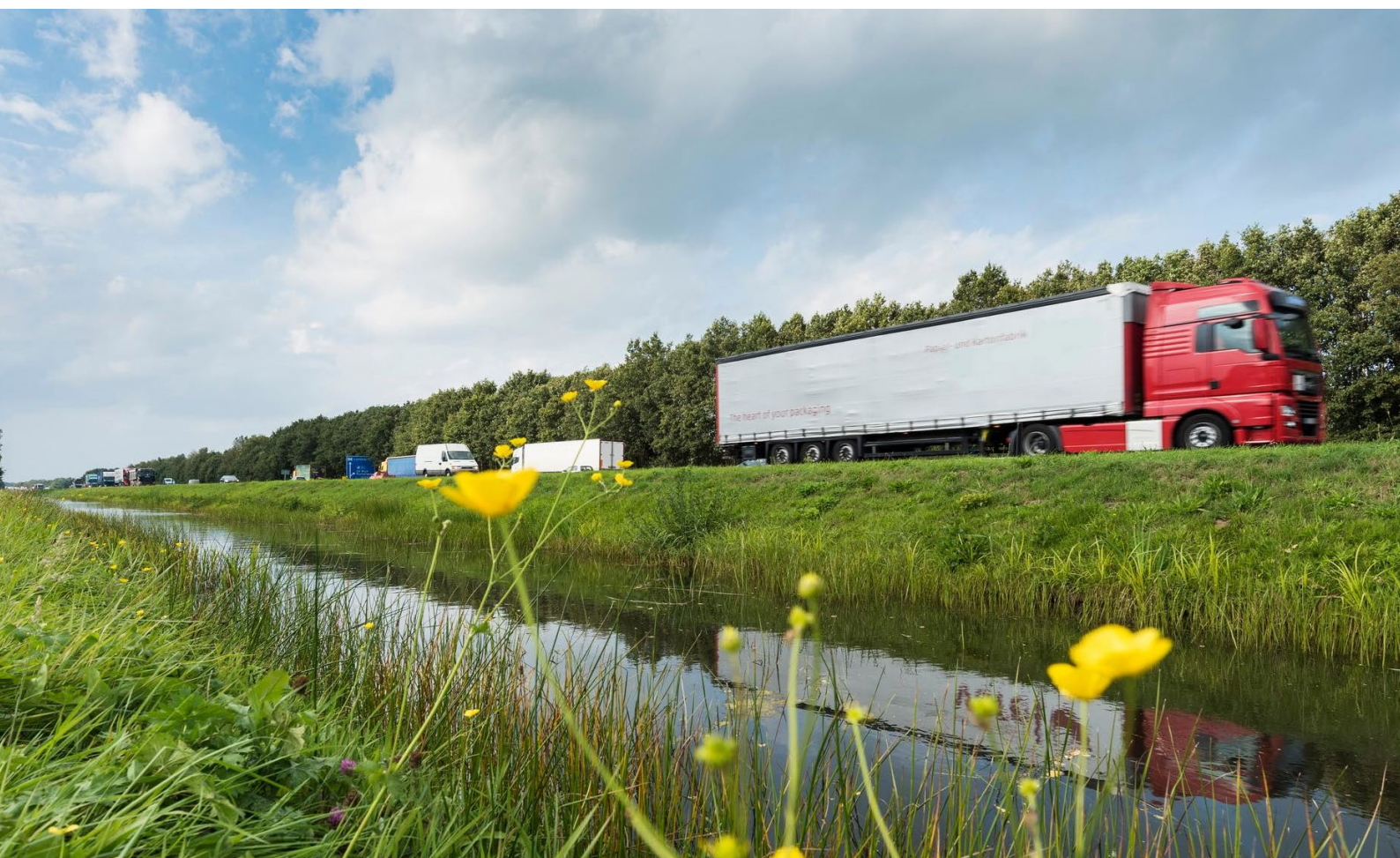
Foto 3: Vrachtwagen bij Abcoude. Straks gaat binnenlands en buitenlands vrachtverkeer betalen voor het gebruik van de weg.