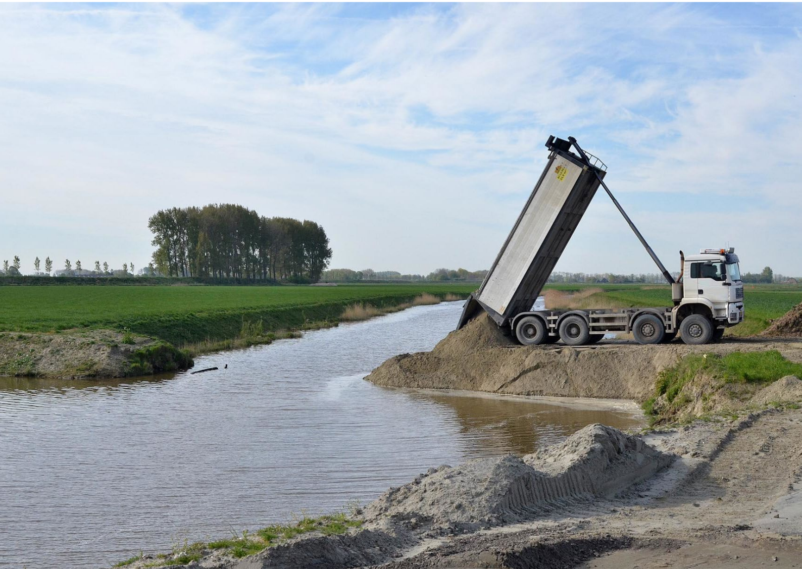
Foto 13: Een kiepwagen stort zand bij de N61. De maatregelen van de terugsluis worden nauwkeurig gemonitord en geëvalueerd.

Met behulp van deze gegevens wordt iedere maatregel elk jaar na de openstelling geëvalueerd om te bespreken of de maatregel het doel heeft bereikt en hoe effectief de maatregel is geweest. Dan komen vragen aan bod als: hoe groot was de belangstelling? Hoeveel budget is gebruikt? Zijn er dingen die een volgende keer beter anders kunnen? Zo kan bijvoorbeeld worden bepaald of een maatregel misschien extra aandacht nodig heeft, of juist zo populair is dat deze eerder gesloten moet worden, omdat het budget al vergeven is.